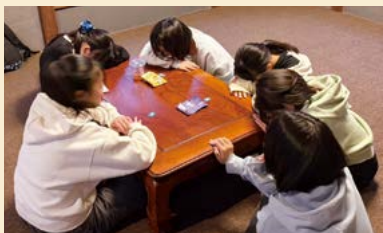
▲ボードゲーム大会