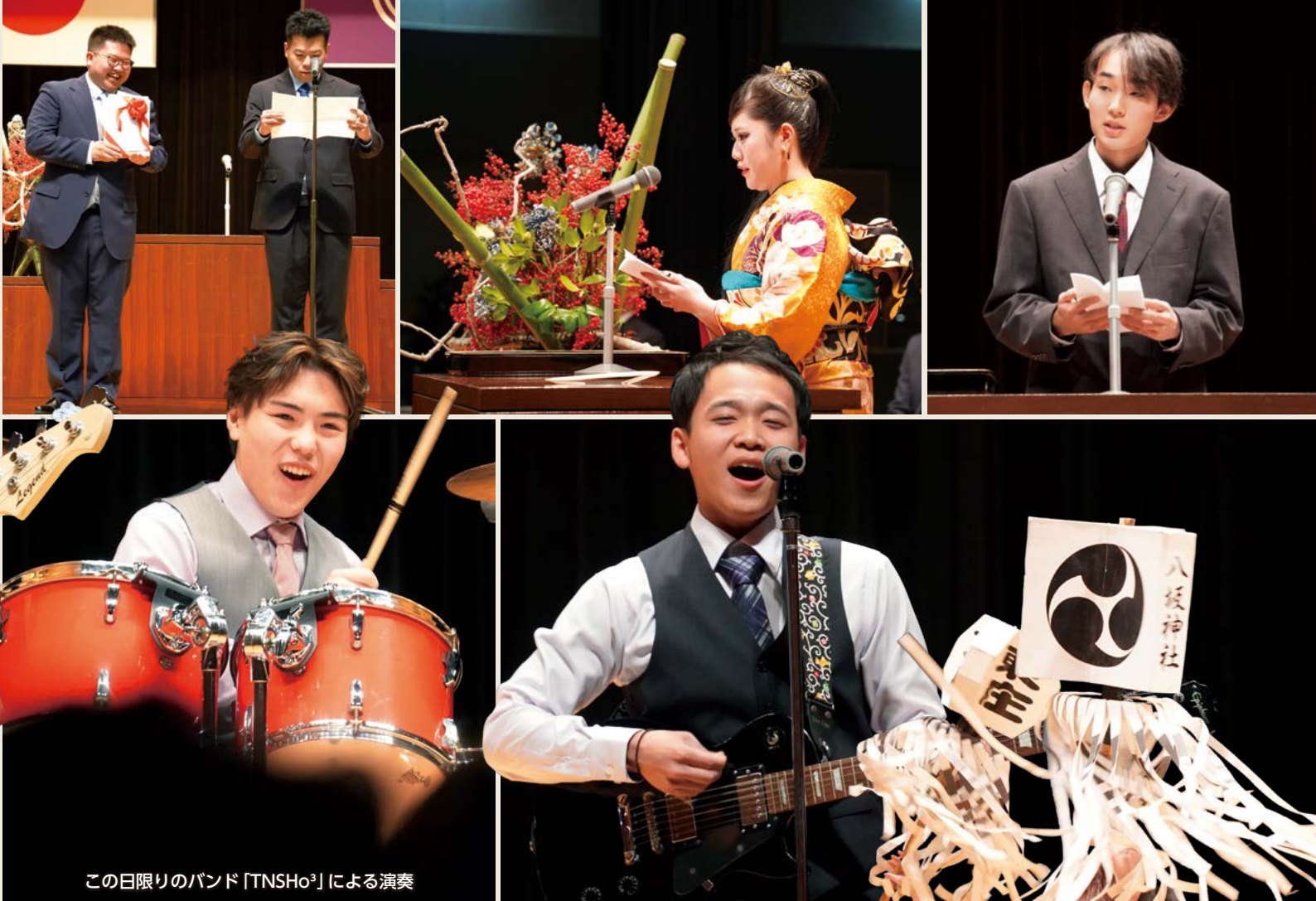
この日限りのバンド「TNSHo³」による演奏