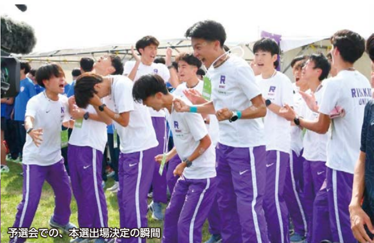
予選会での、本選出場決定の瞬間