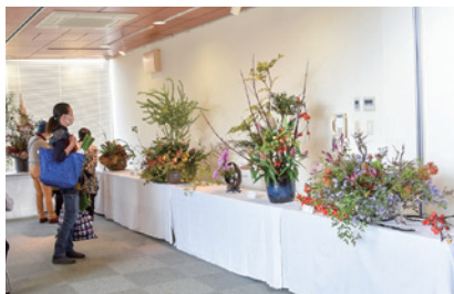
▲一つ一つの作品を真剣に観賞