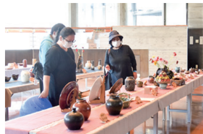
▲陶芸作品も楽しみました