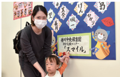
▲子どもの名前を笑い文字にしました

ふれあいまつりと同時開催で、町公民館を会場に東庄町文化祭が開催されました。文化協会の所属団体による芸能発表や作品展示をはじめ、東庄中学校吹奏楽部の演奏や、子育て支援センタースマイルによる展示など、さまざまな発表が行われました。会場には多くの人が訪れ、作品や発表を楽しみました。