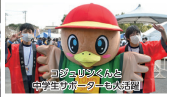
コジュリンちゃんと中学生サポーターも大活躍

東庄ふれあいまつりが、3年ぶりに役場駐車場で開催されました。約7,000人の来場者が訪れ、会場は大賑わいとなりました。