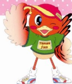
東庄町イメージキャラクター コジュリンくん