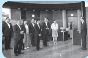
愛知県常滑市議会議員

視察の中で、当町の多目的ホールが議場のみならず、さまざまな用途に使用されていることや、庁舎の視察見学を通し、さまざまな質問や意見が交わされました。