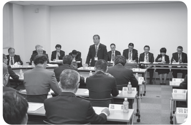
まちづくり会議の様子