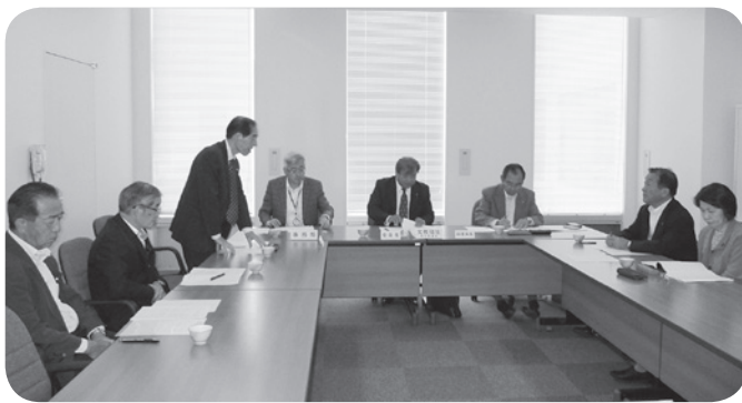
文教福祉常任委員会

以上のような意見等があり、請願第1号・第2号については、採決した結果、当委員会においては、賛成全員により、採択すべきものと決定しました。