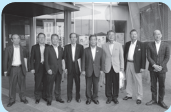
滋賀県豊郷町議会議員の皆さんと