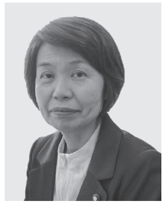
山崎 ひろみ 議員