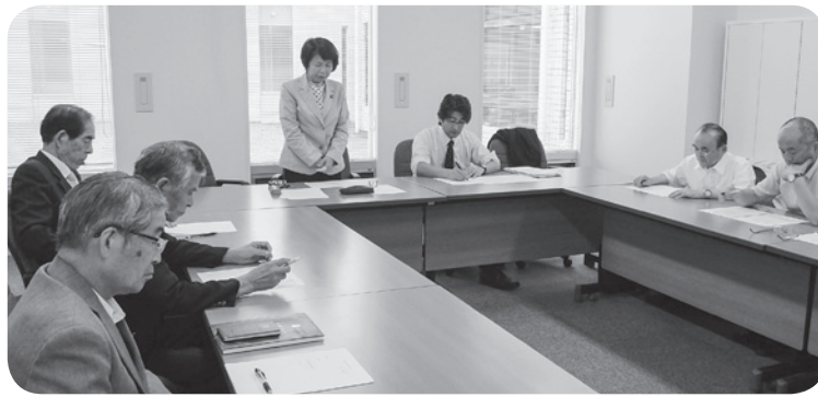
第11回 議会改革特別委員会

に信頼して頂き、議会としての使命が果たせるよう、これからも検討を重ねていかなければならないと思っております。