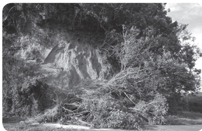
台風15号による倒木（大友地先）

◎専決処分の承認（令和元年度東庄町一般会計補正予算第5号） 台風15号、台風19号及び台風21号に伴う大雨により発生した災害の復旧に関わる費用の補正を専決処分したため、承認を求めるもの。