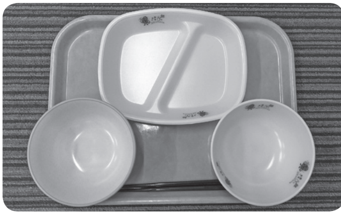
こじゅりんくんマーク付き食器

◎学校給食用備品の購入契約締結 学校給食用備品の購入契約について、関係法令の規定に基づき、議会の議決を求めるものです。