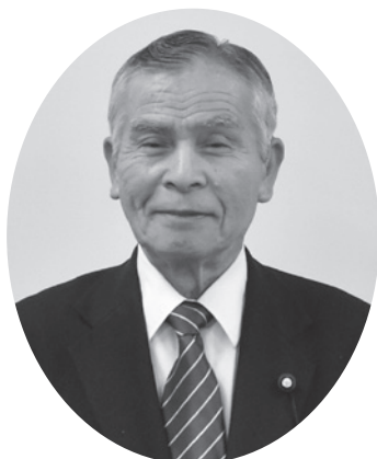
副議長 鈴木 正昭