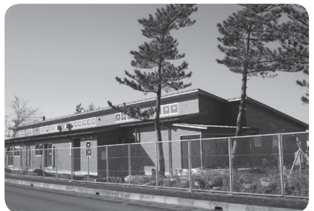
放課後児童クラブ

◎ 地方公務員法及び地方自治法の一部を改正する法律の施行に伴う関係条例の整備に関する条例の制定