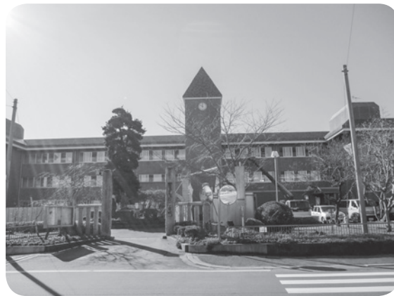
開校を待つ東庄小学校

ほか、国土強靱化地域計画の策定業務委託、香取広域市町村圏事務組合負担金、台風15号等により被災した農業施設に対する補助金、小学校統合に向けた工事費等に係る増額補正です。