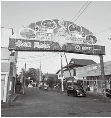
撤去予定の下総橋駅前にある現在のアーチ

デジタルサイネージ ディスプレイなど電子的な表示機器を使い情報を発信する「電子看板」の総称。ポスターや看板の代わりに映像や画像を表示する仕組みのこと。