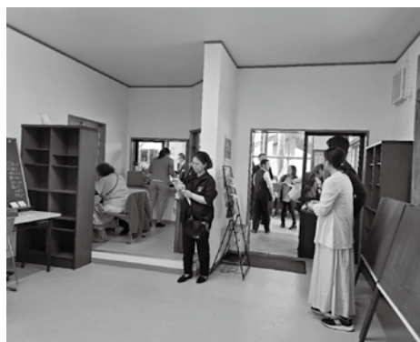
笹川駅舎交流センターの様子