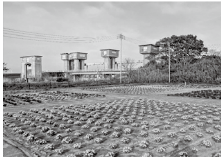
遊具設置が予算化された新宿公園

以上のような質疑等が交わされ、8会計について採決した結果、予算決算常任委員会としては、原案のとおり可決すべきものと決定しました。